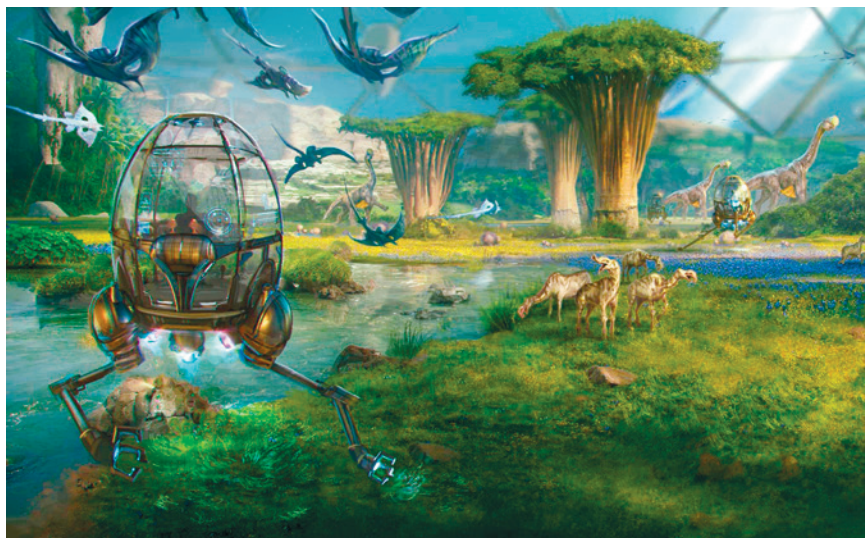
Virtuelles Erlebnis im Alien Zoo ou Virtual Reality-Erlebnis im Alien Zoo.

ARTANIM UND DREAMSCAPE IMMERSIVE REVOLUTIONIEREN UNSERE VORSTELLUNG VON VIRTUELLER REALITÄT.