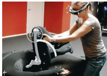
Aufzeichnung von Gelenkbewegungen

möchte – so wie bei der Auswahl eines Films im Kino: Agent im Film «Men in Black», Besucher eines extraterrestrischen Zoos oder Reiter auf dem Rücken eines Drachens in einem Animationsfilm der Dreamworks-Studios. Ziel ist es, dem Publikum Unterhaltungserlebnisse zu vermitteln, bei denen das Reale und das Virtuelle miteinander verschmelzen und das Eintauchen in diese Welt magisch und vollkommen ist. Diese Multiplexkinos wurden nach und nach in fünf Städten – vier in den USA und eines in Dubai – eröffnet. Und warum sollte man nicht demnächst ein solches Kino der virtuellen Realität in der Geburtsstadt dieser Technologie eröffnen, dort, wo alles begann?