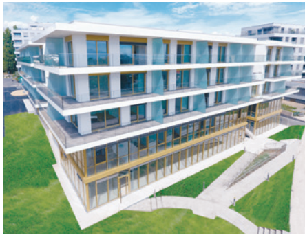
Die Mietimmobilie am Chemin des Saules in Nyon.

Das Investitionsvolumen läge dann bei 1,3 Milliarden Franken. Das Immobilienportfolio der ZKBV besteht zum grössten Teil aus Wohnimmobilien, die sich in den Westschweizer Regionen Genf, Waadt, Freiburg und Neuenburg befinden.