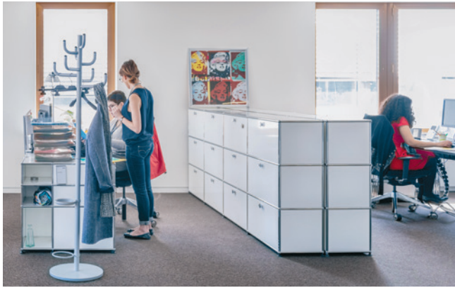
Die Abteilung Kundenberatung.