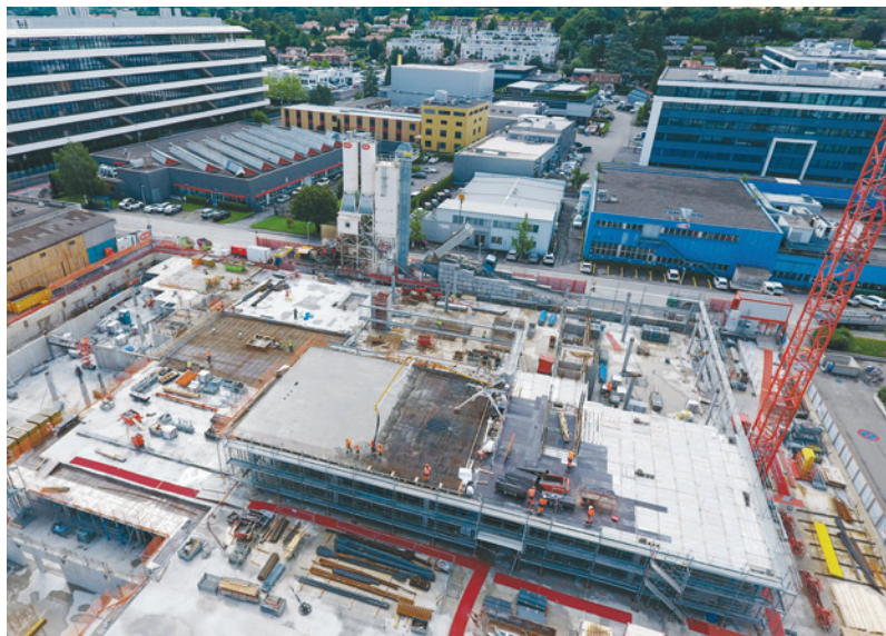
Die Baustelle des Projekts Spark in Plan-les-Quates.

im Bau befindlichen Verlängerung der Tramlinie 15 entfernt, sind in diesem äusserst dynamischen Bereich der Industrie- und Gewerbeaktivitäten mit hohem Mehrwert vereint, die Tradition und Innovation miteinander verbinden. Der Bau dieses Projekts begann im September 2020 und soll in September 2023 in Betrieb genommen werden. Die Planung ist wie bei den meisten Bauvorhaben von grosser Bedeutung. Doch da es sich in diesem Fall um ein Gebäude für Ausbildungszwecke handelt, kommt hinzu, dass der Ausbildungszyklus nicht im Geringsten verändert werden darf, wodurch die Einhaltung des Terminplans höchste Priorität hat. Die Schwierigkeiten liegen bei diesem Projekt im Wesentlichen in der Vielzahl der Beteiligten, insbe-